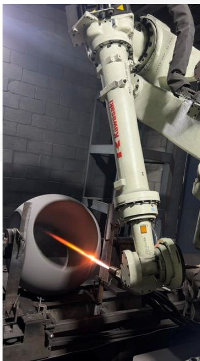
Aplicação por HVOF

O HVOF é uma tecnologia de aspersão térmica que utiliza a combustão de gases (e.g., propano, hidrogênio, querosene) e oxigênio para gerar um jato de alta velocidade (supersônica, até 1200 m/s) e temperatura. O pó de WC-CoCr é injetado nesse jato e acelerado, impactando o substrato com alta energia cinética. Essa colisão resulta em uma compactação densa das partículas, formando um revestimento de baixa porosidade e alta adesão mecânica. A baixa temperatura da peça durante o processo (geralmente abaixo de 150°C) minimiza distorções e alterações metalúrgicas no substrato.