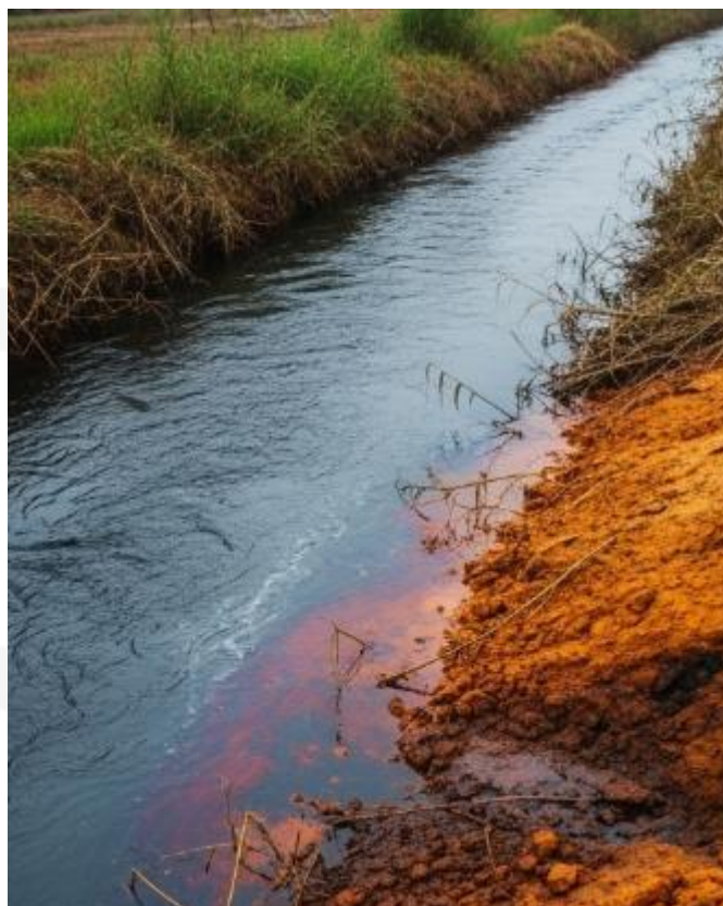
Impacto Ambiental - O descarte de efluentes e lodos